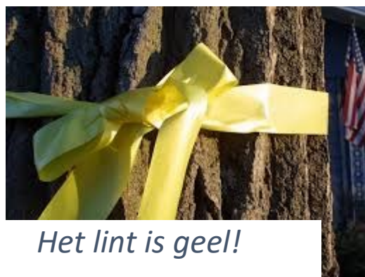
Het lint is geel!

De laatste avond van dit seizoen ging over vergeving. Hoe moeilijk is dat soms, hoe kunnen we daartoe komen, wat is daar voor nodig? Er werd heel openhartig gesproken met persoonlijke voorbeelden. Iemand vergeven kan reinigend werken, negatieve energie kan plaatsmaken voor verzoening. Jezelf vergeven is soms nog moeilijker dan een ander vergeven. Het woord 'sorry' wordt vaak gehoord, te pas en te onpas, wanneer heeft het dan nog echt waarde vroegen wij ons af. De